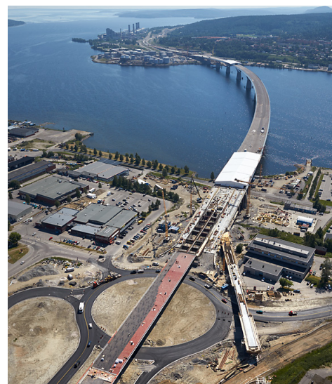
Sundsvallsbron juli 2014